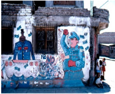
Chili 1986

« Laurencine Lot explore le Chili sous dictature, l'oeil aux aguets et son Leica en mains. Apparemment immobilisé, le pays est en mouvement. Elle photographie avec ardeur les gens qui marchent. Ce que le peuple pense du régime assassin, les murs le disent par les mots et par les images.