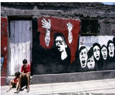
Chili 1986

L'histoire du Chili est marquée par les cicatrices profondes laissées par la chute de Salvador Allende lors du coup d'État du 11 septembre 1973 et les années noires de la dictature. S'y ajoute l'expérience traumatisante des tremblements de terre qui agitent le pays de façon récurrente.